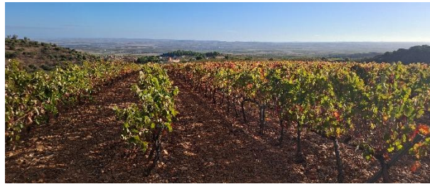
Detalles de la zona agrícola y el pueblo de Almonacid