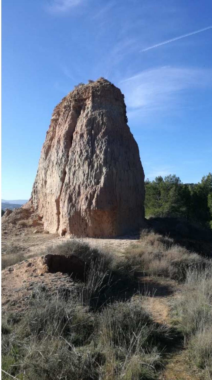
La Mora Encantada

elegiremos la opción más a la izquierda. Casi inmediatamente aparece indicado el desvío (633 km; 8 km) de Alcocer a 100 m, toponimia que se vincula al Cantar de Mío Cid, lugar donde hallamos la Mora Encantada, un resalte arcilloso de curiosa morfología. En este cruce se abandona la pista y se sigue, de frente por camino, bordeando la cabecera de un barranco erosionado.