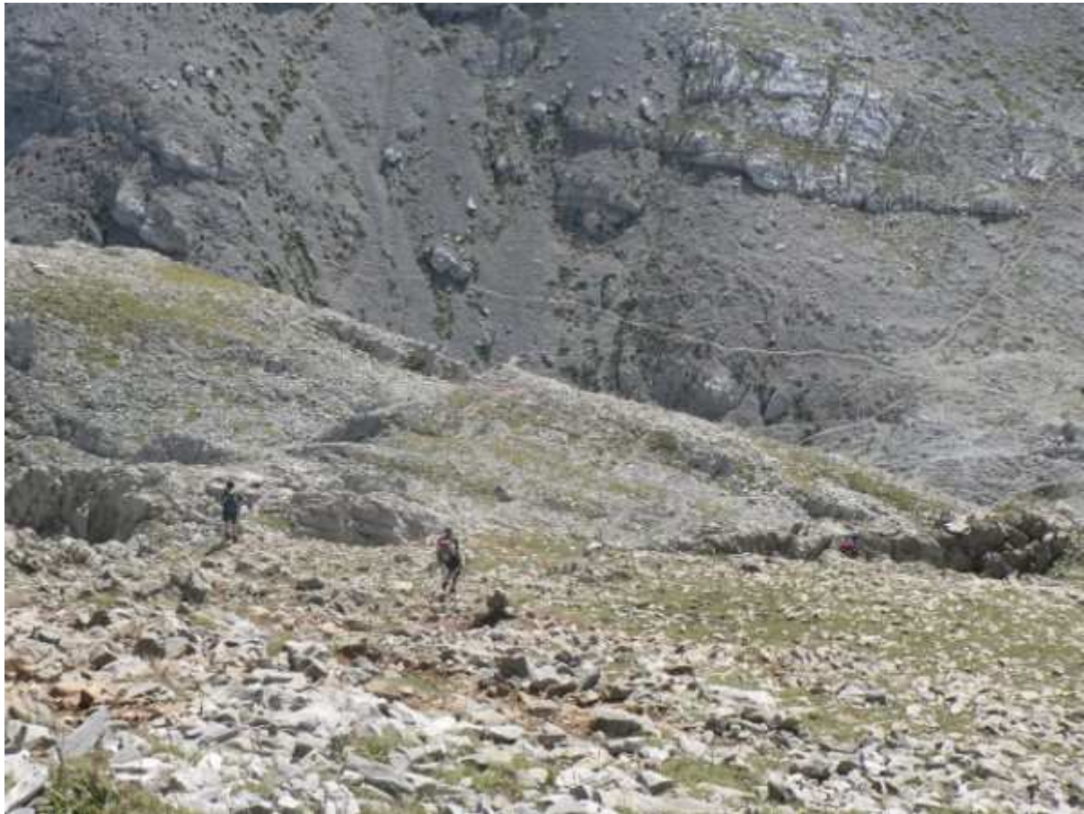
Descenso desde la cima al collado de Ansó.