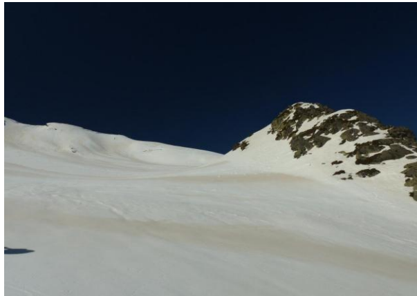
Últimas rampas al “falso Bataillence”

Su ascenso se realiza por el lado opuesto al puerto de Bielsa hacia el que le protege una gran barreira rocosa que salvaremos rodeándola por la izquierda, llegando hasta el cordal de la divisoria y coronando esta elegante cima con los esquís puestos también.