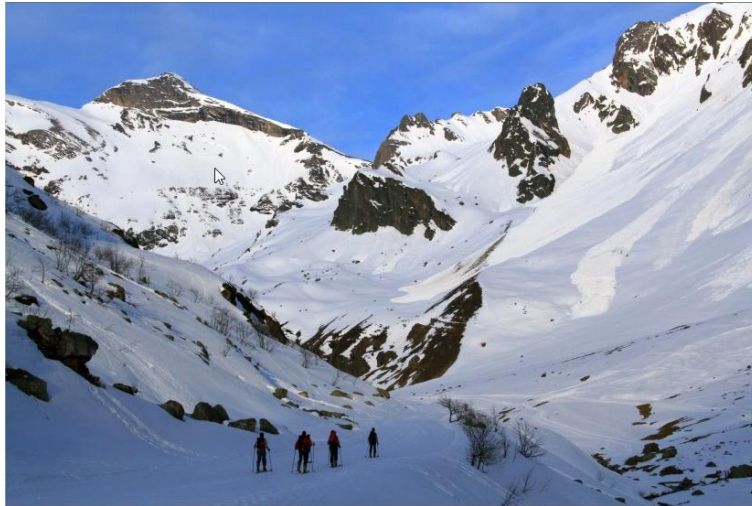
Vista del Soum de Salettes (izquierda) desde el parking de Piau.

Una vez en el collado, giraremos 90° a la izquierda para encarar la última rampa final hasta el pico, inicialmente con pieles, hasta que la nieve lo permita, ya que es una zona muy castigada por el viento. Aproximadamente los últimos 100-150m habrá que hacerlos con crampones y piolet, no siendo necesario portear los esquís ya que la bajada es por el mismo sitio.