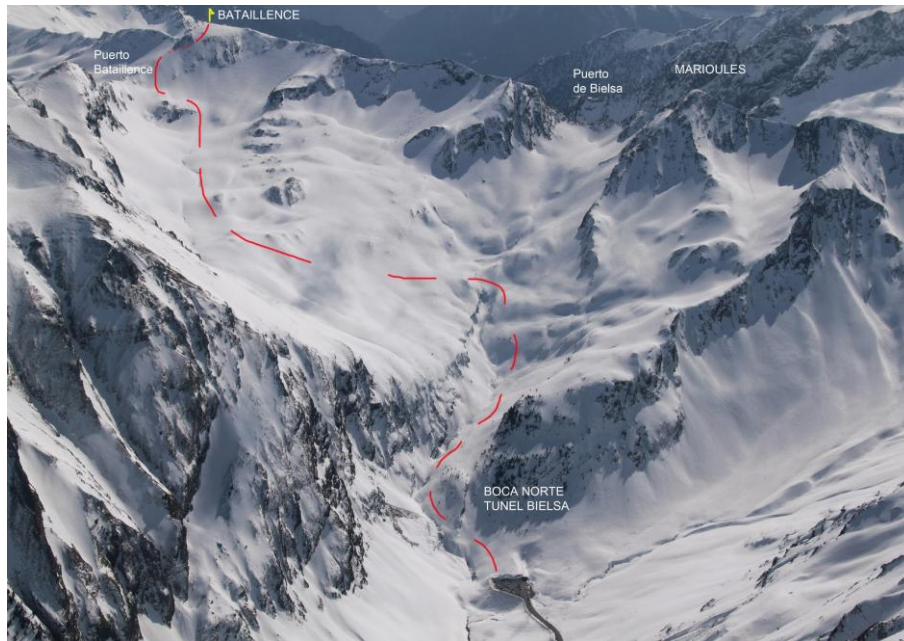
Vista aérea de ambas ascensiones