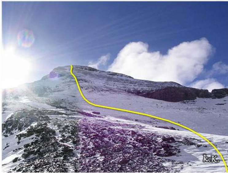
Subida al Soum des Saletes desde el Port de Campbieil

La bajada se realiza por el mismo itinerario de subida. Por tanto, descenderemos hasta el punto donde se hayan dejado los esquís y esquiaremos hasta el collado y de allí por el mismo itinerario de subida, o tendiendo un poco a la izquierda para evitar el llaneo inicial si las condiciones de la nieve lo permiten, volveremos al fondo del valle y retornaremos hasta el parking de Piau.