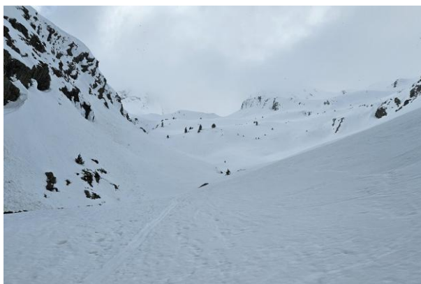
Superado el tramo inicial

Desde el parking de la boca norte del túnel de Bielsa (1850m) saldremos hacia el sur a la izquierda del túnel. Inicialmente hay que salvar un pequeño espolón que, en ocasiones por falta de nieve, puede atravesarse andando.